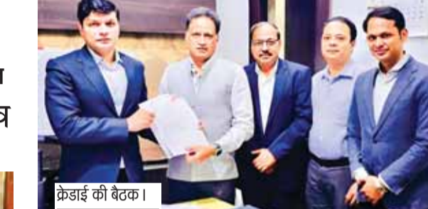
क्रेडाई की बैठक।